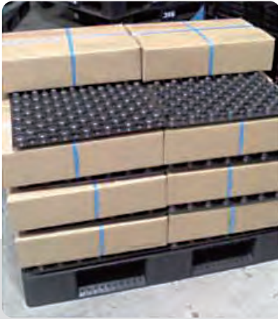
フリーズヘルパー使用例