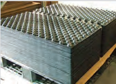
積み高さは100枚で460mmです。